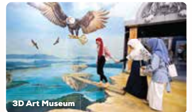
3D Art Museum