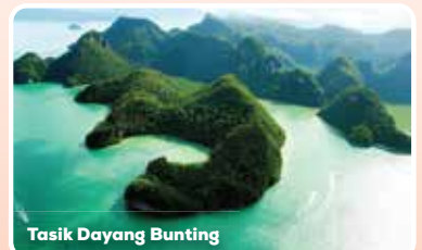
Tasik Dayang Bunting