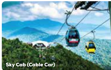
Sky Cab (Cable Car)